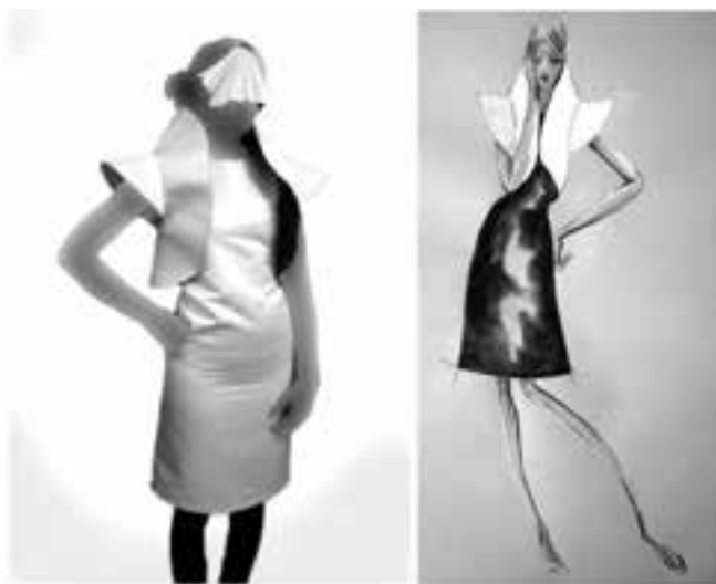
مدل پیراهن شماره ۲

در این مدل لباس از پارچه ساتن آمریکایی در دو رنگ استفاده شده تا ترکیب آنها زیبایی یک لباس خاص را داشته باشد و از ساده‌ترین نوع پلیسه در این طرح استفاده شده و پارچه‌های ساتن را با سه لایه زانفیکس به هم چسبانده؛ چیدمان آنها چنان است که تاها خصوصیات خط مایل را داراست. سادگی طرح بیانگر این موضوع می‌باشد که از قدیم الایام اورنگامی در طراحی لباس به کار می‌رفته هر چند که طراحان با مفهوم اورنگامی آشنا نبوده‌اند در این مدل از ساده‌ترین و ابتدایی‌ترین طرح‌های اورنگامی استفاده شده تا این مفهوم را برسانیم که حتما نباید از طرح‌های پیچیده استفاده کرده و با یک طرح ساده نیز می‌توان زیبایی اورنگامی را به نمایش گذاشت.