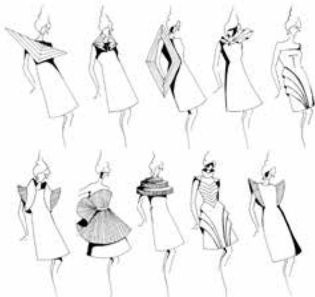
۱- نمونه‌های ساخته شده و تایید شده اوریگامی جهت طراحی لباس

مبحث این پژوهش لباس‌های مفهومی بوده هنر مفهومی همیشه در تکاپوی تاثیر گذاشتن بر مخاطب بوده و بیش از همه نیازمند جلب نظر مخاطبان است. این طرح‌ها ادراکات زیبایی شناختی را به شدت دگرگون می‌سازد و نوعی اخلاقیات تهاجمی و ستیزه‌جویانه و ایجاد شوک در ذهن و احساس بیننده اثر هنری ملتزم می‌سازد.